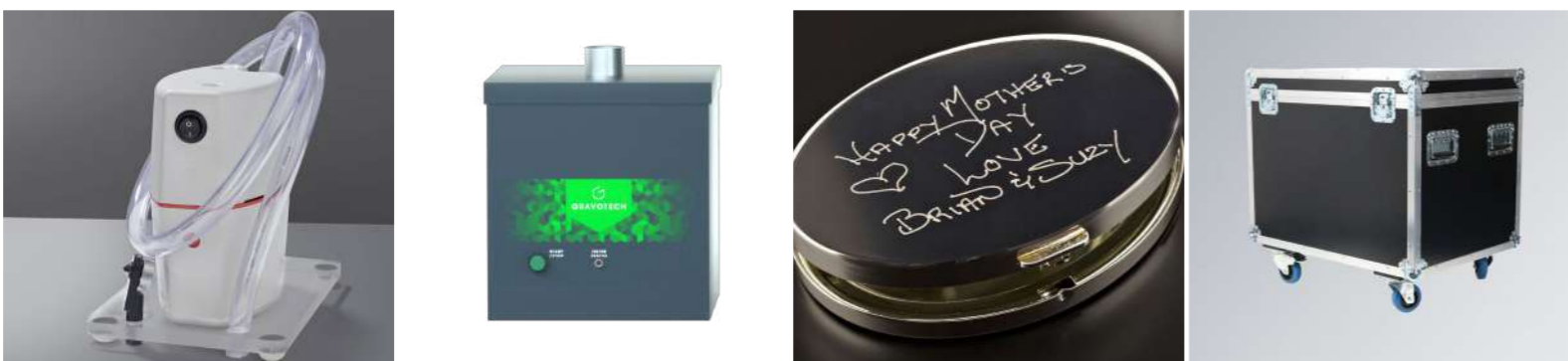
チップコレクタ 彫刻機用 集塵装置 レーザー用 Dedicace™ (デディカス) 彫刻機&レーザー トラベルケース 彫刻機&レーザー