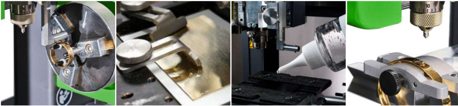
回転軸 カutting治具 エングレービングジェル 治具・固定具